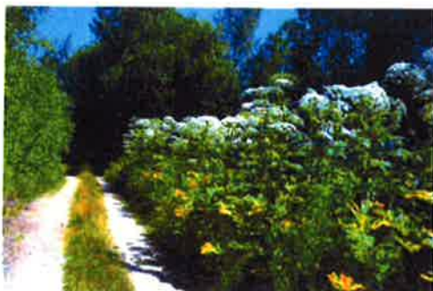
Sumpskog och Björnloka vid vägen till MODO-kajen