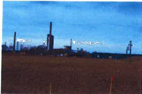
Jordbruksmarken inom planområdet

Nuvarande markanvändning är i huvudsak jordbruksändamål och området är obebyggt. Området ligger i en östsluttning mellan bostadsområdet Kungsängen och naturområdet Ekbacken i väster och Cementa/Nordkalks industrianläggningar i öster. Området korsas i nordväst av gång- och cykelvägen till Malmö. Sydöstra delen av planområdet utgörs av upplagsyta och sumpskog med sly och lövträd. Inom områdets södra och västra del finns högspänningsledningar samt VA-ledningar norr om vallen, dessa tillhör bebyggelsen på Malmö.