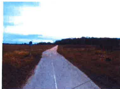
Cykelvägen till Malmö