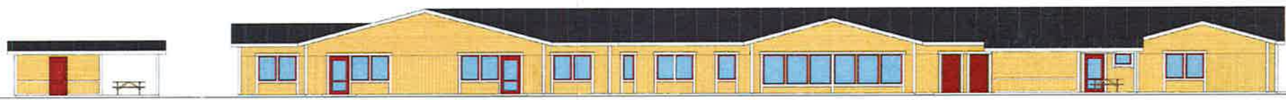
Fasad mot Väster