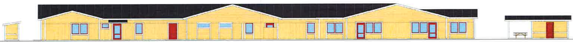
Fasad mot Öster