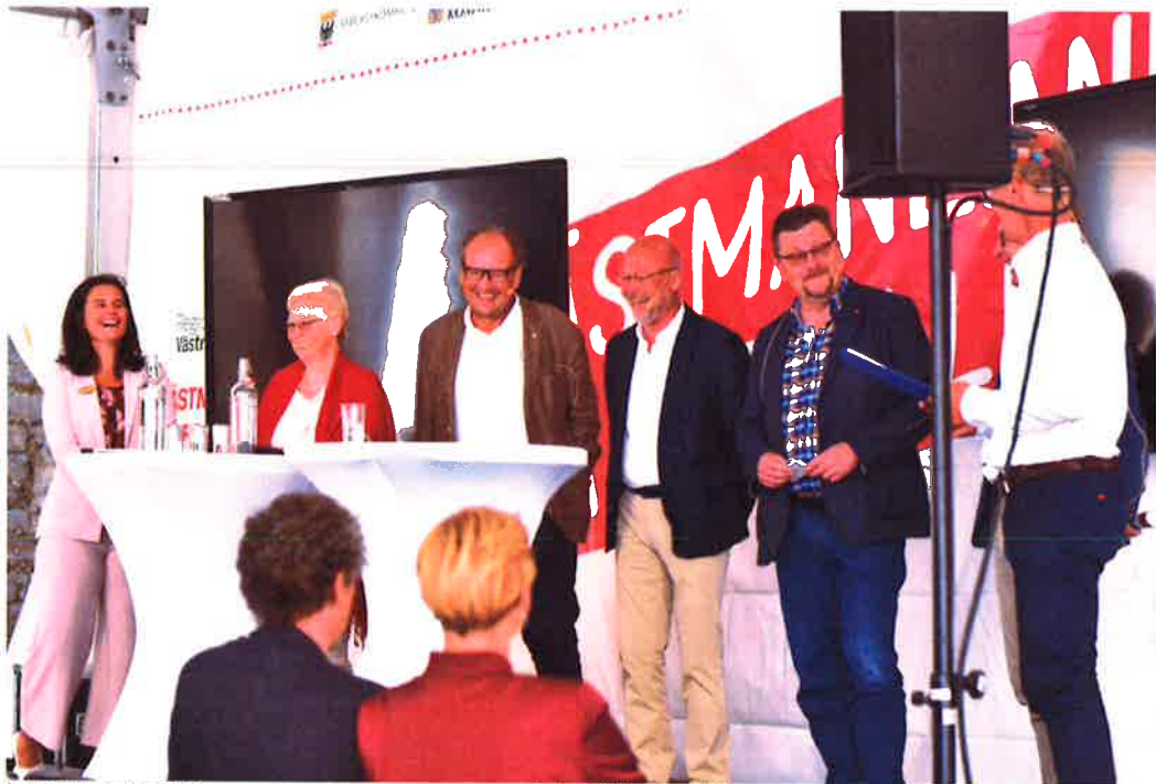
Lyckat seminarium när Köping, Arboga och Kungsör besökte Almedalen

Köping, Arboga och Kungsör kommuner tillsammans med näringslivsrepresentanter från Västra Mälardalen arrangerade seminarium i Almedalen i samarbete med Region Västmanland.