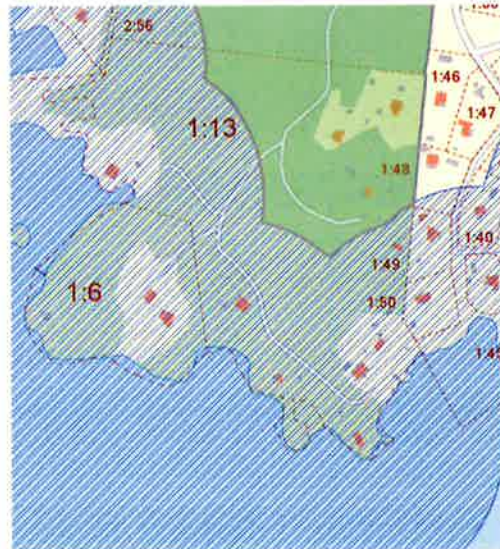
Figur 2. Strandskyddat område

En bedömning och inventering på plats kring naturvärden samt identifiering av vad som är ianspråktaget behöver göras. För att upphäva strandskydd krävs särskilt skäl enligt miljöbalken 7 kapitlet 18 c §. Ett av de särskilda skäl som skulle kunna vara aktuellt för att upphäva strandskyddet för de befintliga tomterna är att platsen redan är ianspråktagen. Med nya obebyggda tomter är det viktigt att det vid en placering inom strandskyddat område sker så att de nya tomterna är väl avskilda från området närmast strandlinjen genom bebyggelse, vilket då kan anges som särskilt skäl. En annan möjlig lokalisering av nya tomter är att placera dem utanför strandskyddat område.