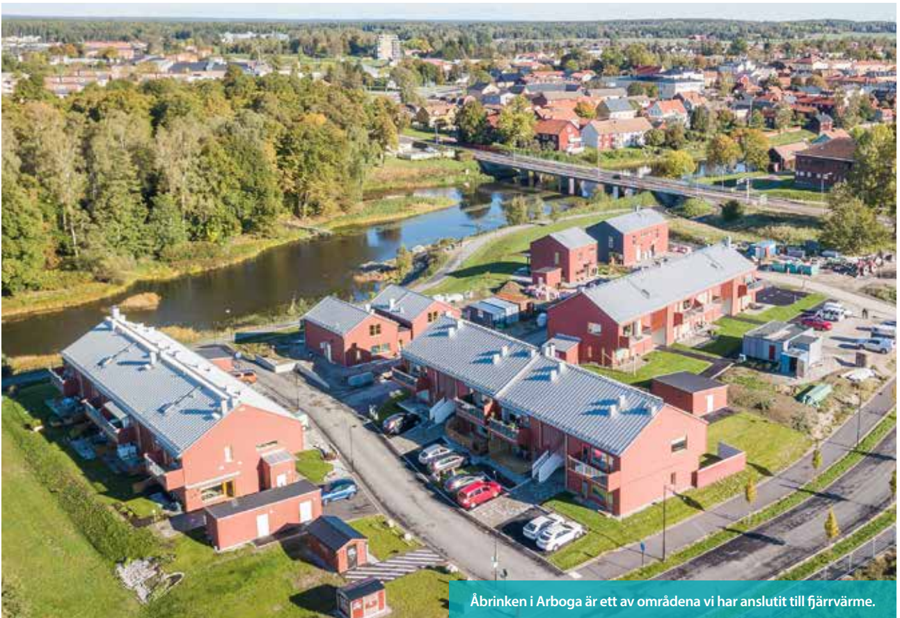
Åbrinken i Arboga är ett av områdena vi har anslutit till fjärrvärme.