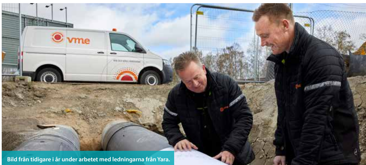
Bild från tidigare i år under arbetet med ledningarna från Yara.